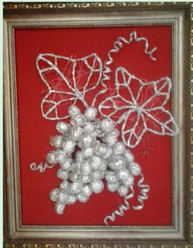
Заноскина Кристина 13 лет «Гроздь винограда»